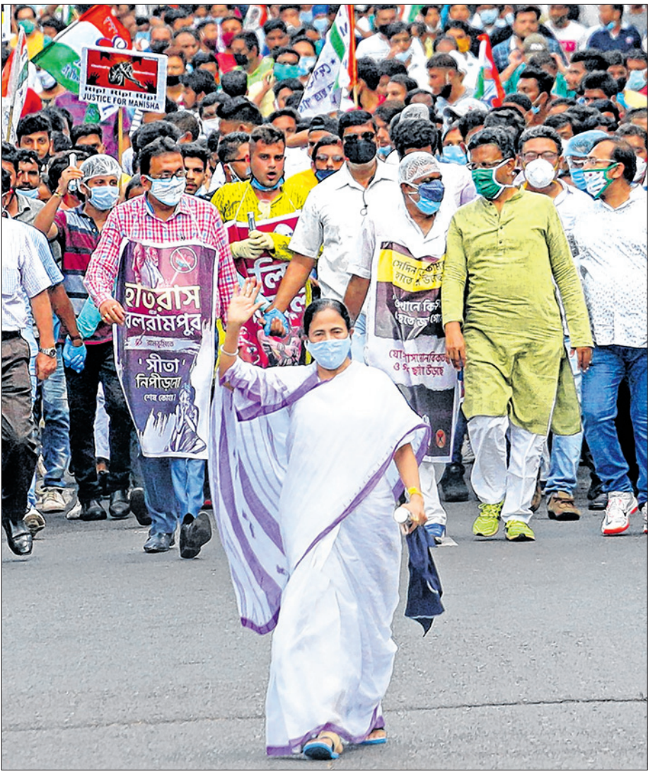
কলকাতার রাজপথে হাথরস কাণ্ড নিয়ে মিছিল মমতা বন্দোপাধ্যায়ের। শনিবার।

স্টাফ রিপোর্টার: কোভিড বিধি মেনেই সাত মাস কোনও কর্মসূচি নেননি। কিন্তু উত্তরপ্রদেশের হাথরসে দলিতকন্যার উপর অত্যাচার তাকে আর ঘরে বসে থাকতে দিল না। প্রতিবাদে পক্ষে নামলেন তৃণমূলমন্ত্রী মমতা বন্দোপাধ্যায়। হাতে কালো পতাকা আর টর্চ নিয়ে শনিবার বিড়লা তারামণ্ডলের সামনের জগুরলাল নেহরু রোড ধরে সোজা মেয়োরোড, গান্ধীমূর্তির পাদদেশ। অনেকদিন পর কলকাতায় তাঁর মিছিল। শেষে বক্তৃতা। ক্ষোভ উগরে দিলেন। তবে কষ্ট মেন ভার। বললেন, “আমার মন পড়ে আছে উত্তরপ্রদেশের ওই গ্রামে। যে গ্রামে আমার এক দলিত বোনকে অত্যাচার করে খুন করে ছাড়িয়ে দিল। তার পরিবারকে দেখতেও দিল না।” আশঙ্কা করে বলেছেন, “বিজেপিই হচ্ছে দেশের সবচেয়ে বড় যানভেদিক। রাষ্ট্রপতি শাসনের দিকে যাচ্ছে দেশ। স্বৈরতন্ত্র চলছে। কোনও গণতন্ত্র দেশে নেই।”