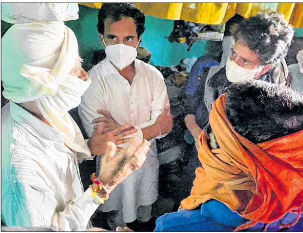
হাথরস পরিবারের সঙ্গে কথা বলছেন রাহুল ও প্রিয়াঙ্কা।