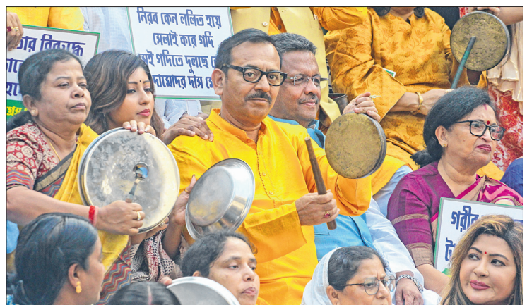
■ বিধানসভায় কেন্দ্রীয় বঞ্চনার বিরুদ্ধে তৃণমূল বিধায়কদের ধরনা। বৃহস্পতিবার।

উল্লেখ্য, বাংলার ৪৭৪টি স্বাস্থ্য কেন্দ্র, ৬৫টি রক স্বাস্থ্যকেন্দ্র, ২৮টি প্রাথমিক স্বাস্থ্যকেন্দ্র তৈরির জন্য একাধিক কিস্তিতে টাকা নয়ের পাঠায়