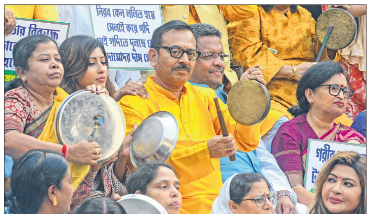
বিধানসভায় কেন্দ্রীয় বঞ্চনার বিরুদ্ধে তৃণমূল বিধায়কদের ধরনা। বৃহস্পতিবার।

স্টাফ রিপোর্টার: স্বাস্থ্যকেন্দ্রের রং গেরুয়া করতে হবে। এই শর্ত দিয়ে জাতীয় স্বাস্থ্য মিশনের টাকা আটকে রাখা হয়েছে কেন, তা নিয়ে ক্ষুব্ধ মুখ্যমন্ত্রী এবার চিঠি লিখলেন প্রধানমন্ত্রীকে। মমতা বন্দ্যোপাধ্যায়ের সাক্ষাৎ, “জাতীয় স্বাস্থ্য মিশন প্রকল্পে বাংলার জন্য বরাদ্দ টাকা ক্রত মটিয়ে দিতে হবে।” এতদিন একশো দিনের প্রকল্পে আর্থিক বঞ্চনা, বাড়ি ও রাস্তার টাকা আটকে দেওয়া ছিল মূল কেন্দ্রবিরোধী ইস্যু। তা নিয়ে নাগাড়ে আন্দোলনও চালাচ্ছেন তৃণমূলনেত্রী। এবার সেই বঞ্চনার তালিকায় যুক্ত হল জাতীয় স্বাস্থ্য মিশনের বরাদ্দ। স্বাস্থ্যকেন্দ্রের রং যে গেরুয়া করার শর্ত দেওয়া হয়েছে, একথা মুখ্যমন্ত্রী ইতিপূর্বে জানিয়ে ক্ষোভ প্রকাশ করেছিলেন। এদিন সরাসরি তিনি চিঠি লিখলেন নরেন্দ্র মোদিকে।