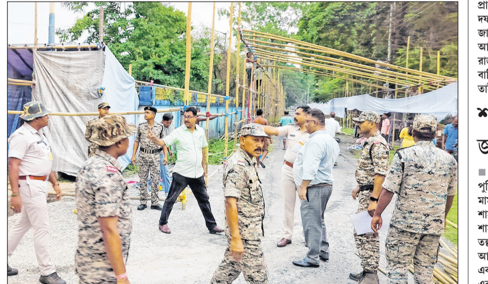
জলপাইগুড়িতে গণনাকেব্রের সামনে পুলিশ ও কেন্দ্রীয় বাহিনীর তৎপরতা। সোমবার।

আজ এগজিট পোলের ই পরীক্ষা। ভোট এলেই এবং ভোট শেষ হলেই অবশ্য প্রতিবাহাই এই পরীক্ষা হচ্ছে।